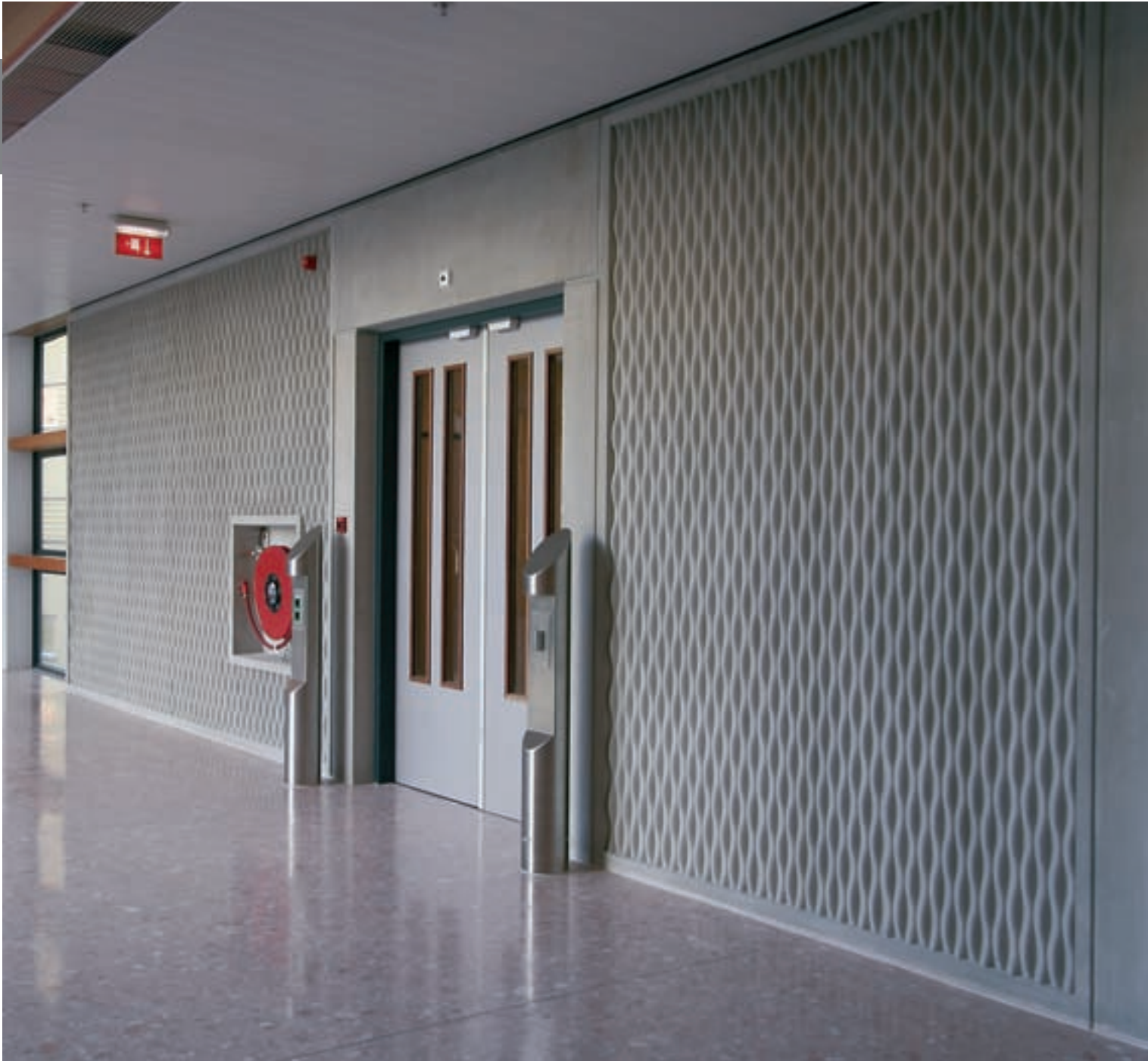
1/43 Corse (invers)